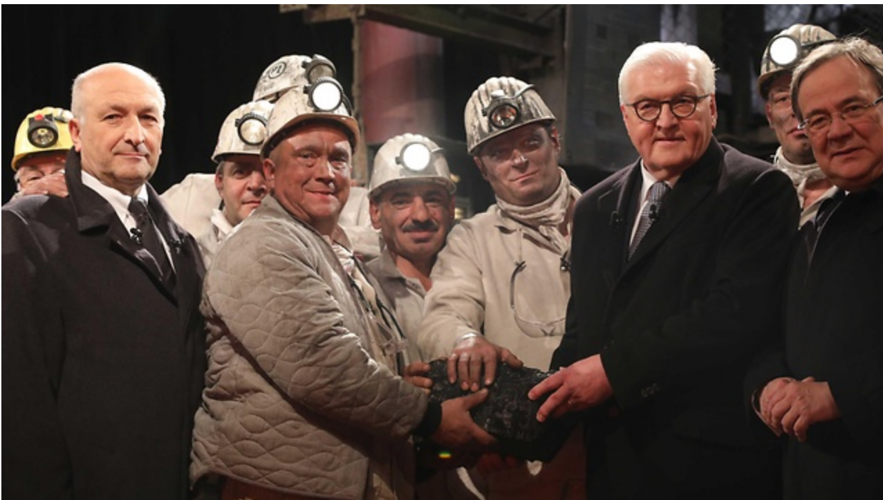
Bundespräsident Frank-Walter Steinmeier nimmt das letzte Stück Steinkohle in Bottrop entgegen.

Als Bundespräsident Frank-Walter Steinmeier am Freitagnachmittag das letzte Stück in Deutschland geförderter Steinkohle in den Händen hält, können die Kumpel ihre Rührung kaum verbergen. Bei vielen fließen nach der letzten Fahrt und dem letzten Glückauf auf der Schachanlage Franz Haniel in Bottrop die Tränen. Steinmeier betont: „Das ist mehr als ein Stück Kohle. Das ist Geschichte.“ Denn für das Ruhrgebiet bedeutet der Abschied von der Steinkohle eine historische Zäsur.